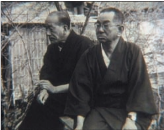
Yasujiro Ozu (à gauche) avec, à ses côtés, Kogo Noda.

C'est la Shochiku qui produit Bonjour , un studio réputé, l'un des plus importants du Japon et fondé en 1920, historiquement le deuxième après la Nikkatsu (1912) ; Ozu entre à la Shochiku à l'été 1923 comme assistant caméraman et réalise là ses cinquante-quatre films 5 , du premier (1927) au dernier (1962), à trois exceptions près dans les années 1950. Estimé au Japon dès les années 1930 et considéré dans sa dernière décennie de pleine activité comme le plus célèbre réalisateur du studio, Ozu fut toute sa vie un « employé modèle », à la